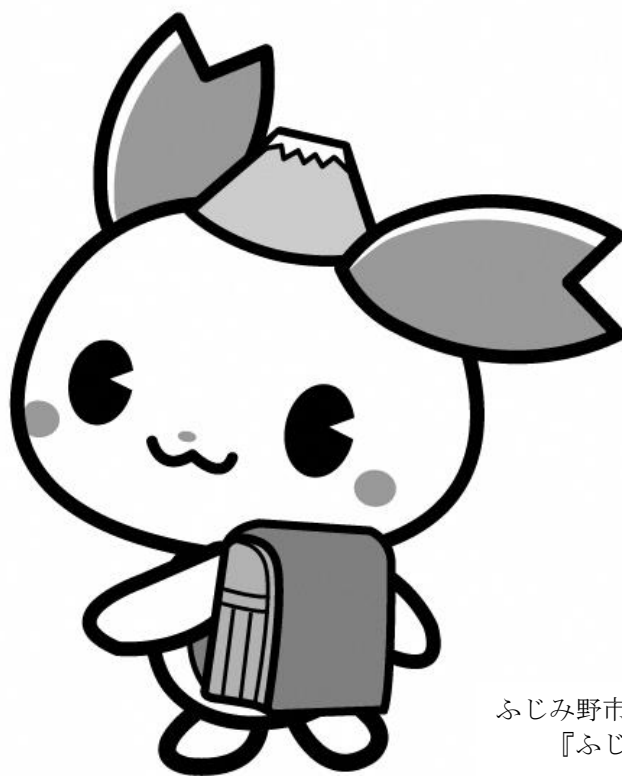
ふじみ野市 PR 大使 『ふじみん』